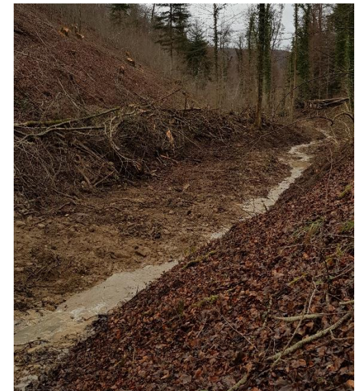
„Bachputzete“ des „Buechholdebächli“ nach Holzschlag