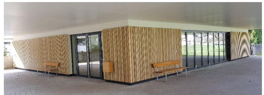
Die sanierte Friedhofhalle